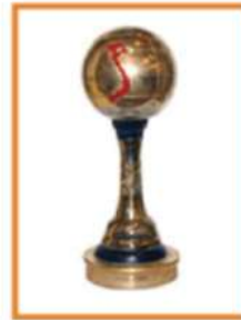
Giải Cầu Vàng -ゴールデンボール賞