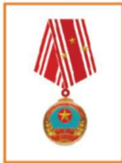
Huân Chương Độc Lập Hạng 3 三レベルの独立メダル