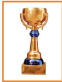
Cúp Sen Vàng -ゴールデン ロータスカップ