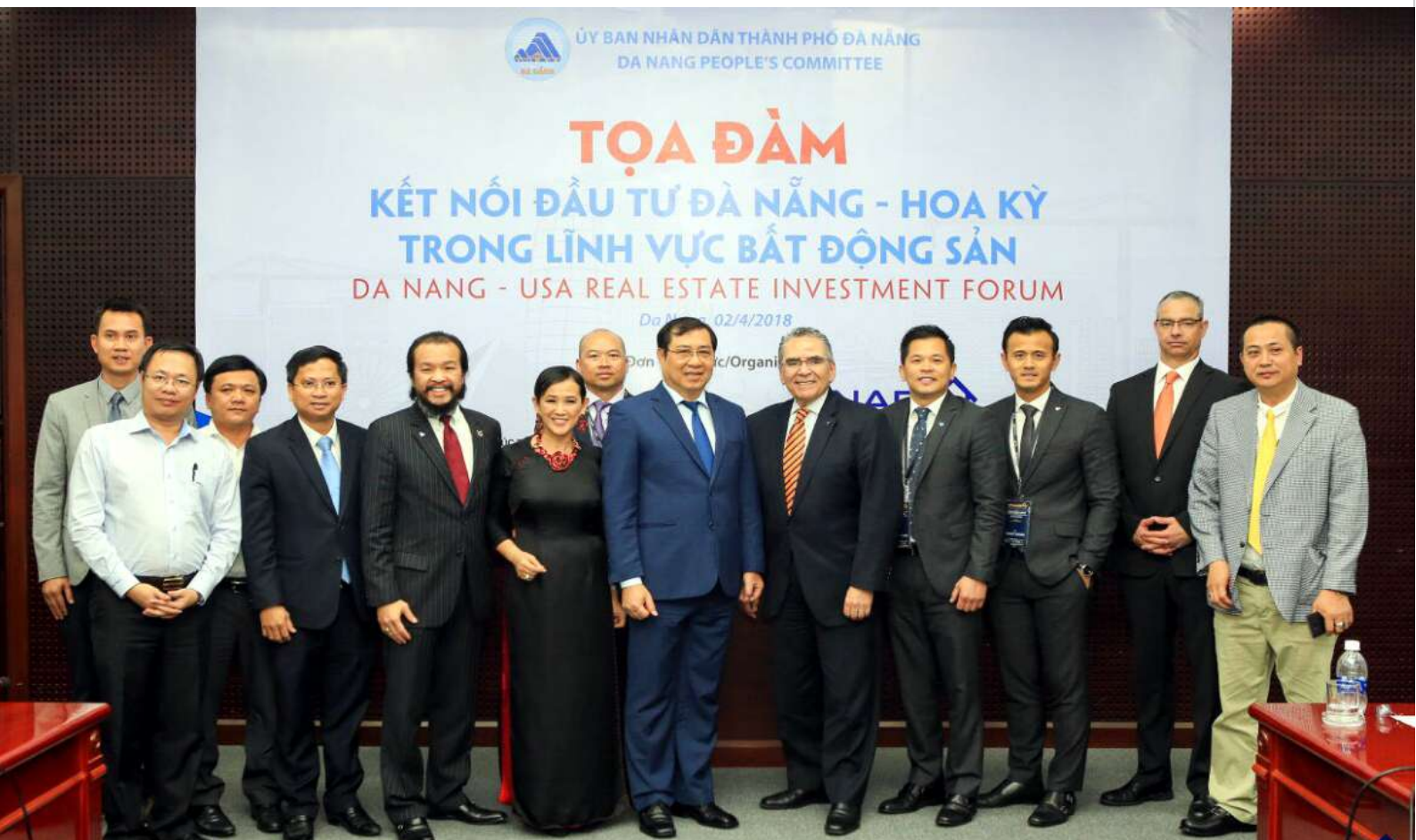
Kết nối đầu tư trong lĩnh vực bất động sản với thị trường Hoa Kỳ