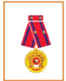
Huân Chương Lao Động Hạng Nhì -二レベルの労働メダル