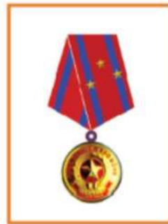
Huân Chương Lao Động Hạng Ba -三レベルの労働メダル