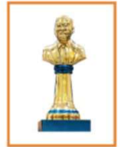
Giải Thường Bạch Thái Bưởi Bach Thai Bui賞

Office : 21 Tran Phu St., Hai Chau Dist., Danang City, Vietnam