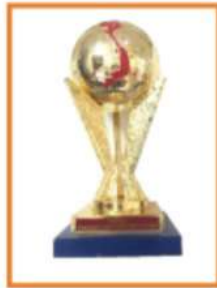
Siêu Cúp Thương Hiệu Mạnh -強いブランドカップ