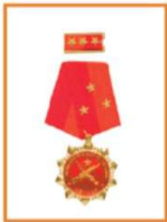
Huân Chương Bảo Vệ Tổ Quốc 国家保衛メダル