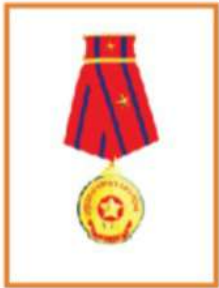
Huân Chương Lao Động Hạng Nhất 一レベルの労働メダル